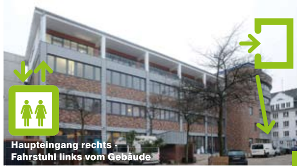
Haupteingang rechts - Fahrstuhl links vom Gebäude

Profitieren auch Sie von unserem Netzwerk! XING - Unternehmerinnen International - Standort Hamburg